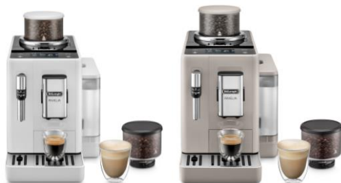
BLANC ARCTIQUE FEB4435.W