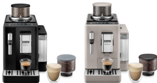
NOIR ONYX FEB4435.B